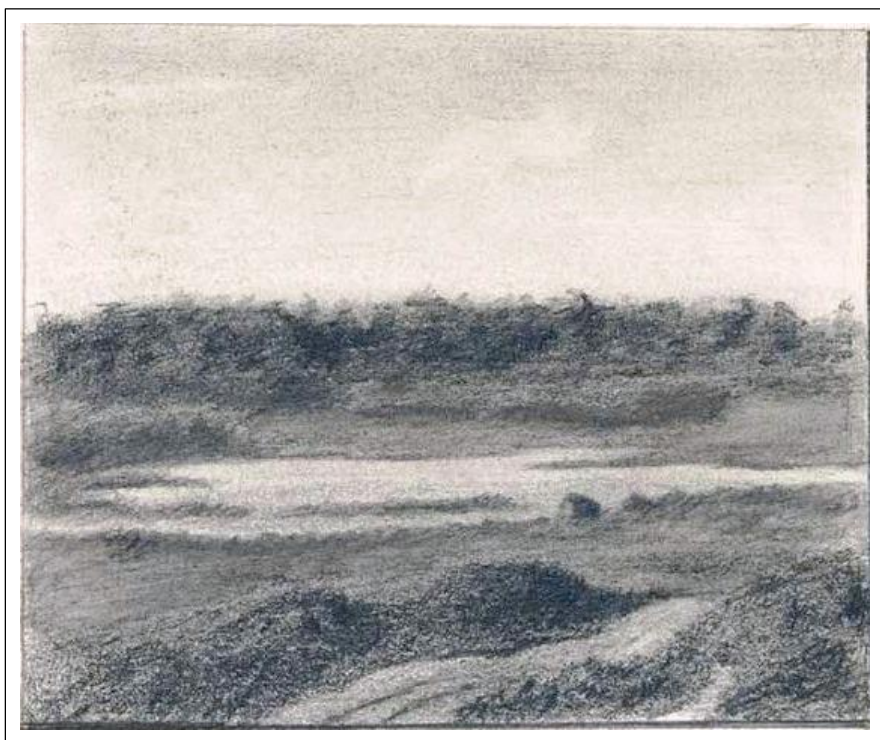
Н.К. Рерих. На Озертицкие озёра с курганов. 1893.