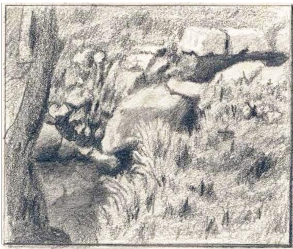
Н.К. Рерих. Ключи в Изваре. 1893.