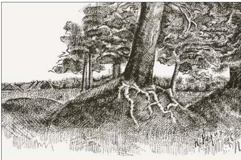
Н.К. Рерих. Курганы при д. Чёрной. 1896.

*) Около деревни Чёрной есть несколько старинных курганов. (Примеч. Н. Рериха).